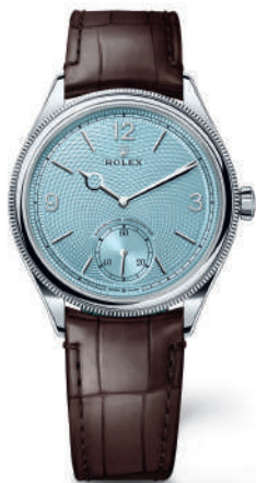
PERPETUAL 1908 EN PLATINO

Es, en más de un sentido, la expresión más pura de vida.