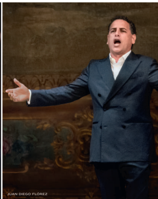
JUAN DIEGO FLÓREZ